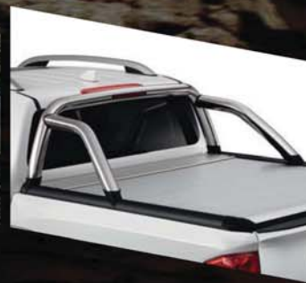
COUVRE BENNE AVEC ARCEAUX EN ACIER INOXYDABLE, ANTENNE AILERON DE REQUIN - KE546-4K10C*

*Veuillez vérifier l'applicabilité auprès de votre concessionnaire local.