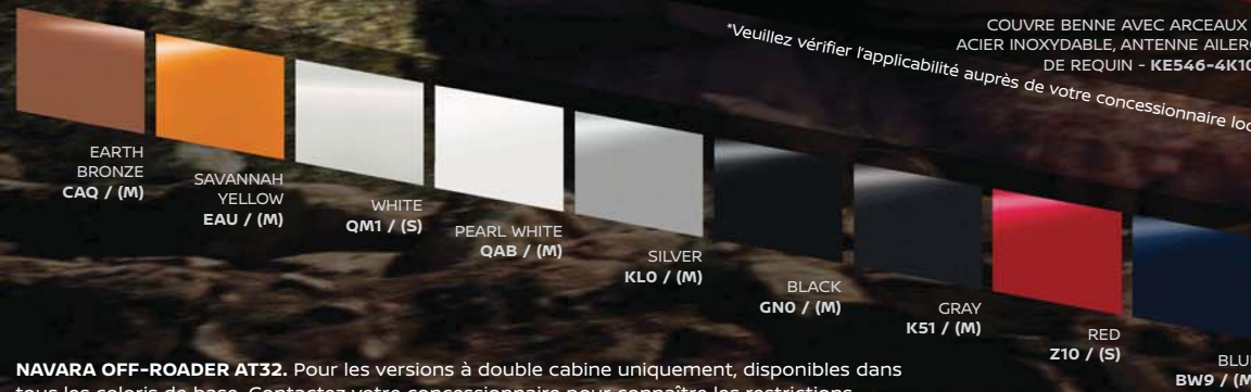
EARTH BRONZE CAQ / (M)

*Veuillez vérifier l'applicabilité auprès de votre concessionnaire local.