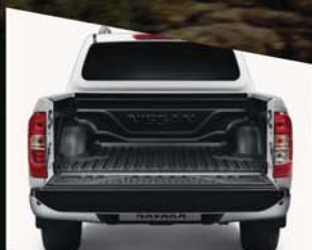
BAC DE BENNE PLASTIQUE KE932-4K00B*