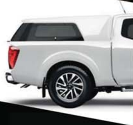
HARDTOP PREMIUM KE850-4K51T*

EMMENEZ VOTRE NAVARA OFF-ROADER AT32 ENCORE PLUS LOIN AVEC LES ACCESSOIRES AUTHENTIQUES NISSAN ET BIEN PLUS ENCORE, DISPONIBLES SUR LE SITE WEB DE NISSAN !