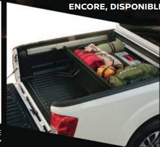
ORGANISEUR DE BENNE KE854-4K000*